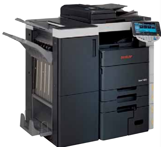
ineo + 451 mit Broschürenfinisher (FS-608)

Die ineo + 451 verfügt über zwei Controller: Den ineo Controller und den optionalen Fiery Controller. Das Besondere ist, dass beide Controller parallel genutzt werden können. Während gewöhnliche Dokumente direkt auf dem ineo Controller produziert werden, ist der Fiery Controller für ein anspruchsvolleres Farbmanagement – z.B. mit ICC Profil Support – ausgelegt. Die exzellenten Druckergebnisse werden nicht nur Agenturen zu schätzen wissen.