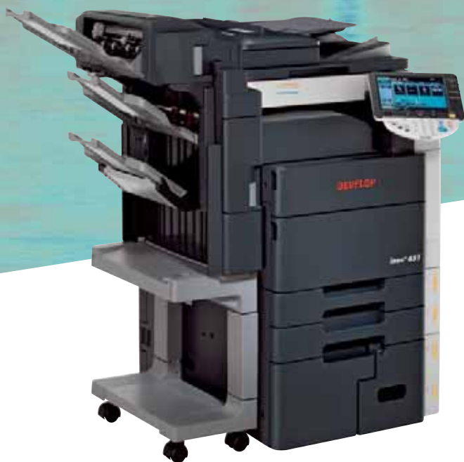
ineo+ 451 mit internem Finisher (FS-519) und Heft- und Falzeinheit (SD-505)