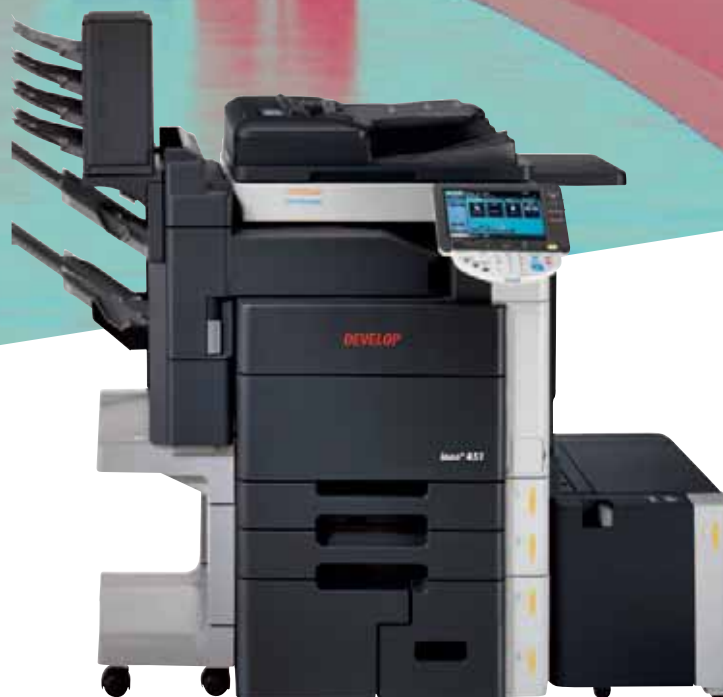
ineo+ 451 mit internem Finisher (FS-519), Mail Bin-Einheit (MT-502) und Großraumkassette (LU-301)