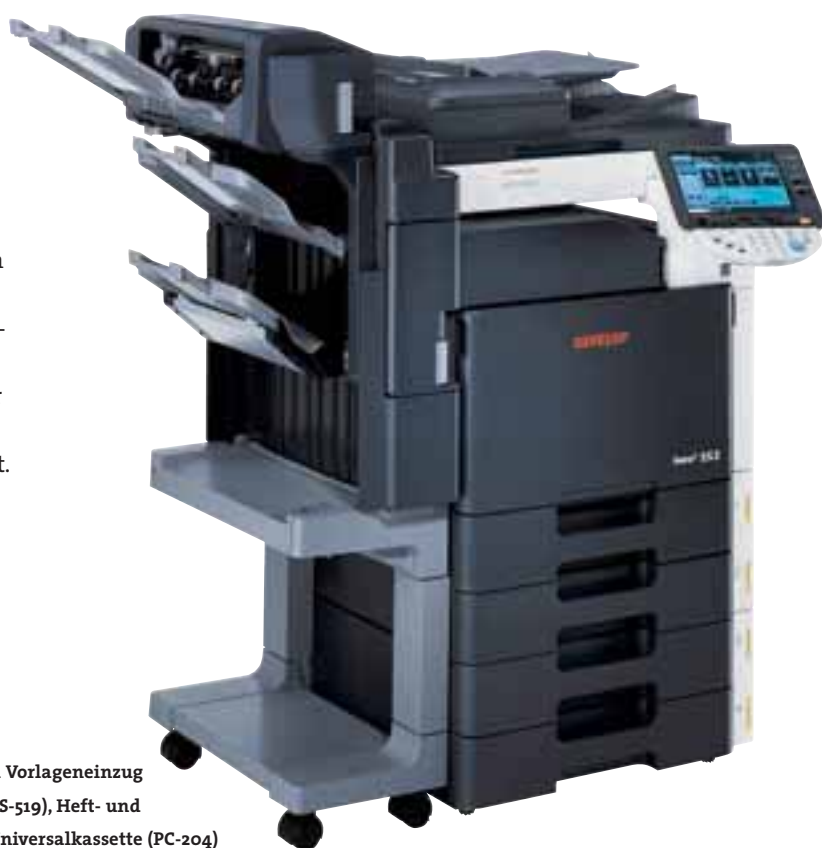
ineo + 253 mit automatischem Vorlageneinzug (DF-611), internem Finisher (FS-519), Heft- und Falzeinheit (SD-505) und 2 x Universalkassette (PC-204)

Die ineo + 253 macht mit ihren vielen Möglichkeiten auch das Leben Ihres Netzwerkadministrators einfacher: schneller Zugriff, einfache Integration und Überwachung aller vernetzten Geräte, automatischer Statusbericht per E-Mail, individuell programmierbare Authentifikation sowie Kontendaten für jeden Benutzer und begrenzte Zugriffsrechte, z. B. für Farbdruck. Wirksame Sicherheits-Features und Verschlüsselungsoptionen machen das System komplett.