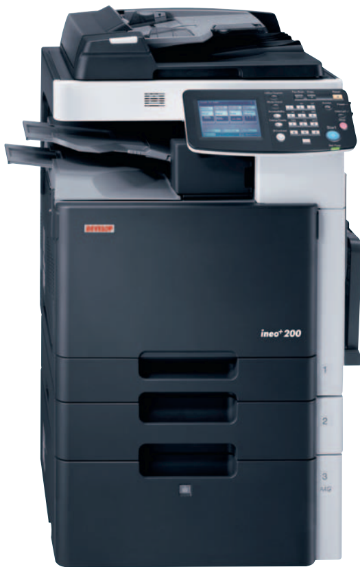
ineo+ 200 mit Vorlageneinzug (DF-612), Job Separator (JS-505), Multi Bypass Tray (MB-502), Universal Papier Kassette (PC-105) und großer Papier Kassette (PC-405)

Die Anforderungen an die Kommunikation ändern sich laufend: War der Schwarzweiß-Druck gestern noch völlig ausreichend, wird heute erwartet, dass das Firmenlogo oder auch andere Elemente farbig gedruckt sind. Nicht nur das Farbe wichtige Informationen hervorhebt, sie vermittelt auch das Gefühl von Professionalität und lässt jegliche Art von Dokumenten hochwertiger aussehen. Ob gedruckte Präsentationen, Anschreiben oder Rechnungen – Ihre Möglichkeiten sind nahezu unbegrenzt. Denken Sie daran – Farbe setzt einfach Akzente! Die ineo+ 200 macht den Einstieg in die bunte Welt der Farben leicht: Denn sie ist kostengünstig, leicht zu bedienen und hat außerdem viele nützliche Funktionen.